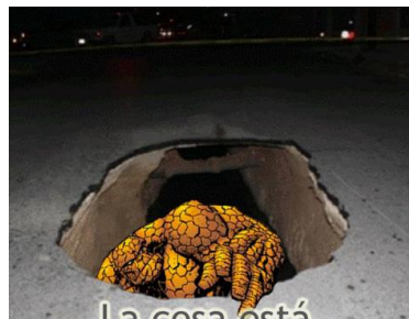
La cosa está que se sale